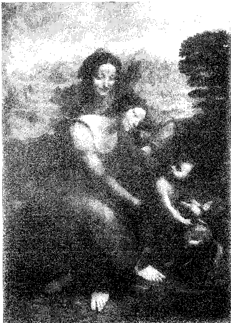
Santa Ana, la Virgen y el Niño.

figura de María, sobre la cual se ve la figura todavía más pequeña de Cristo niño». 12 En Leonardo, María está sentada en el regazo de su madre, se inclina hacia adelante y extiende ambos brazos hacia el niño, que juega con un corderito, sin duda maltratándolo un poco. La abuela apoya en su cadera su único brazo visible y mira a ambos desde lo alto con beatífica sonrisa. El grupo no deja de tener, por cierto, una apariencia un poco forzada. Pero la sonrisa que juega en los labios de ambas mujeres, si bien es inequívocamente la misma que la del cuadro de Monna Lisa, ha perdido su carácter ominoso ( unheimlich ) y enigmático; expresa interioridad y calma beatitud. 13